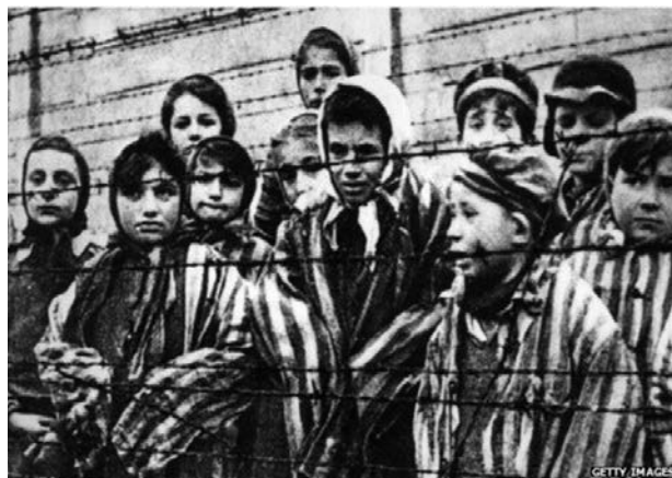
FOTOGRAFIA 2. Presoners d'un camp de concentració nazi