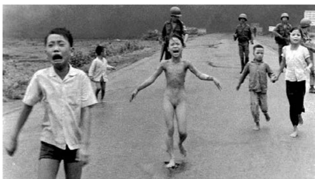
FOTOGRAFIA 3. Vietnam (8 de juny de 1972)