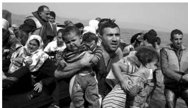
FOTOGRAFIA 4. Refugiats sirians a l'illa de Lesbos, a Grècia