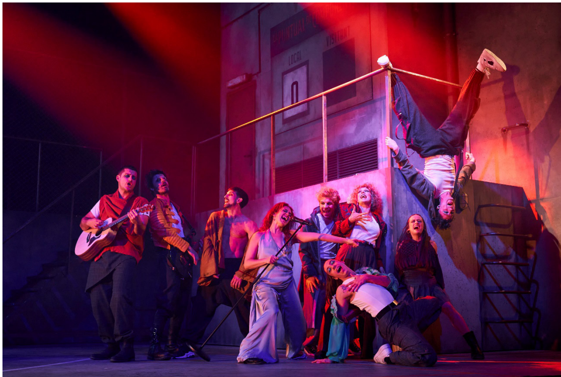
L'alegria que passa , de Dagoll Dagom. Teatre Poliorama, 2023.

A partir del visionament que heu fet del musical L'alegria que passa , de Dagoll Dagom, basat en el text homònim de Santiago Rusiñol i estrenat al Teatre Poliorama el 2023, expliqueu les característiques de la proposta coreogràfica del muntatge i com es relaciona amb la temàtica de l'obra. El vostre text ha de tenir entre dues-centes i dues-centes cinquanta paraules.