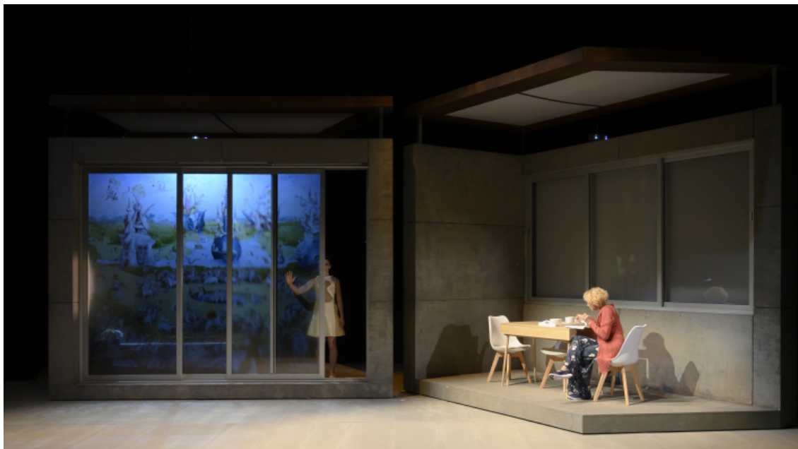
Alba (o el jardí de les delícies) , de Marc Artigau. TNC, 2018.

A partir del visionament que heu fet d' Alba (o el jardí de les delícies) , de Marc Artigau, dirigida per Raimon Molins (TNC, 2018), i tenint-ne en compte l'enfocament de ciència-ficció, analitzeu de quina manera la proposta escenogràfica fa ressaltar els nuclis temàtics de l'obra. El vostre text ha de tenir entre dues-centes i dues-centes cinquanta paraules.