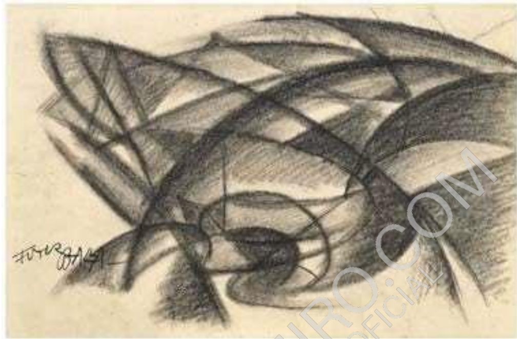
Giacomo Balla, Linee di velocità + vortice (Línies de velocitat + vòrtex), 1913-1914. Llapis Conté sobre paper, 18,5 × 28 cm.

Observeu atentament les imatges següents: