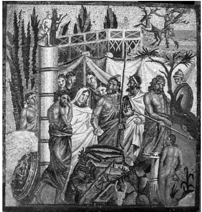
Museu d'Arqueologia de Catalunya (Empúries)

— Com serà el retorn d'Agamèmnon a casa?