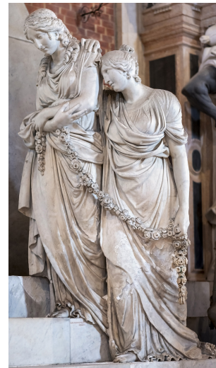
Mausoleu d'Antonio Canova (ca. 1827. Venècia, església de Santa Maria dei Frari)