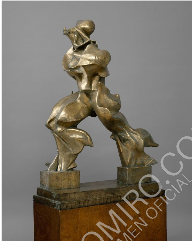
Umberto Boccioni, Formes úniques de continuïtat en l'espai . Londres, Tate Modern