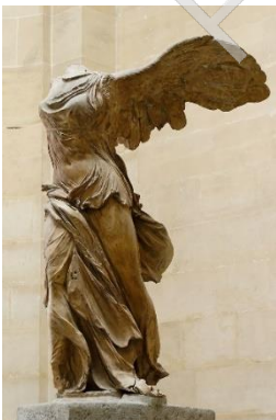
Victòria de Samotràcia . 190 a.C.