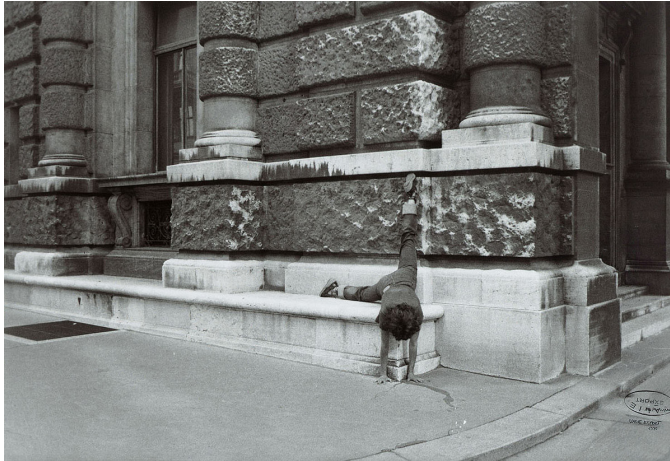
IMATGE A. Body configurations («Configuracions corporals»). Fotografia en b/n, 56 × 79 cm.

Observeu les imatges següents, corresponents a tres obres: