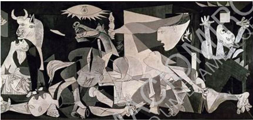
IMATGE C. Guernica . Oli sobre tela, 349,3 × 776,6 cm.

1.1. Empleneu la taula següent donant la datació aproximada de cada obra (indicant la dècada de creació). Escriviu-hi també a quin moviment i a quin artista (o artistes) pertany cadascuna. [0,75 punts]